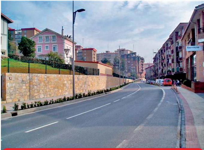
Avenida Lasagabaster , redacción del proyecto aprobada durante la anterior legislatura por el Gobierno Municipal Socialista.

Con respecto a la acera de la Avda Lasagabaster :