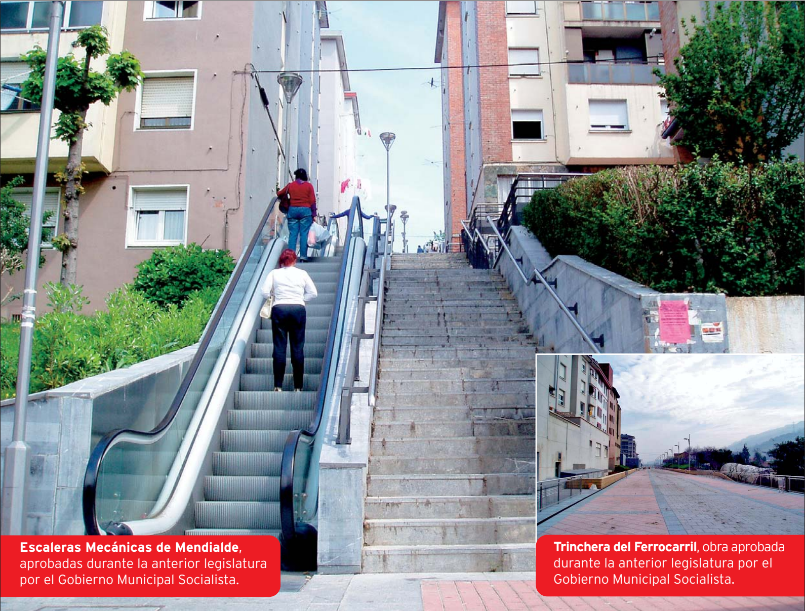
Escaleras Mecánicas de Mendialde, aprobadas durante la anterior legislatura por el Gobierno Municipal Socialista.